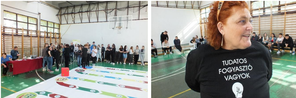
11.-12. kép: „A Nagy Fogyasztóvédelmi Vetélkedő”

„TESZEDD” akció (iskolánk és a ZKN közös programja) Osztályok 10. F. és a 10. E.