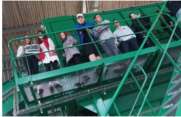
6.-7. kép: Diákok a ZKN szelektív hulladék feldolgozó telepén

A feldolgozandó, a város által „termelt” hulladék mennyiségének látványa és a munka összetettsége ráébresztette a tanulókat a környezetkímélőbb termékek használatának fontosságára. Az üzemlátogatás után mindenki elgondolkozott az eldobható csomagolóanyagok felhasznált mennyiségén is.