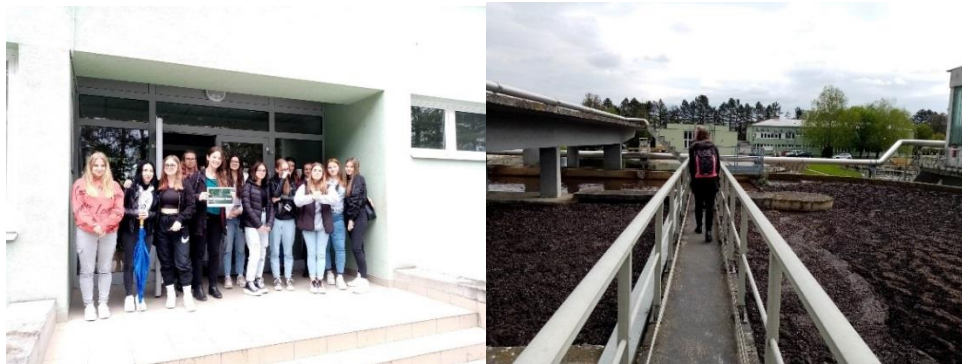
4.-5. kép: Diákok a ZALAVÍZ szennyvíztisztító telepén

A tanulók megismerkedtek a víztisztítással és a biogáz előállításával. Ez utóbbi azért is fontos, mert a zalaegerszegi autóbuszok nagy része már biogáz üzemeltetésű.