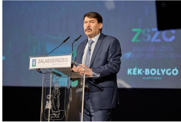
10. kép: Áder János tanórája