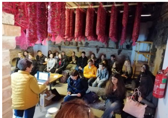
1. kép: Diákok Tilajban

Iskolánk 5 éve nyerte el fogyasztói tudatosságra nevelő iskola címet. Ennek megfelelően egész tanévben folyamatosan részt veszünk olyan programokon, melyek a tanulók környezettudatosságát növelik. Évek óta minden szeptemberben egy- egy osztály ellátogat Tilaj községbe, ahol megtekintik a helyi aszalót és a gyümölcsfeldolgozó üzemet is, valamint előadásokon vesznek részt, ahol a rövid ellátási lánc jelentőségével ismerkednek meg.