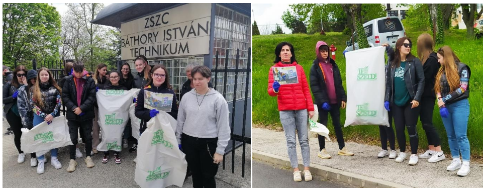
13.-14. kép: „TESZEDD”

„TESZEDD” akció (iskolánk és a ZKN közös programja) Osztályok 10. F. és a 10. E.