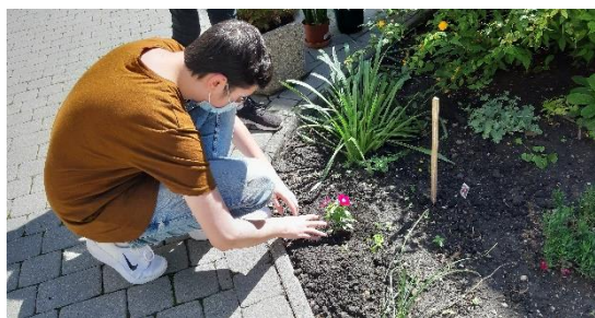
Írta: Pálinkás Margit (ökoiskola koordinátor)

(Virágok és gyümölcsfák ültetése a Föld Napja alkalmából, a Fenntarthatósági Hét keretében.)