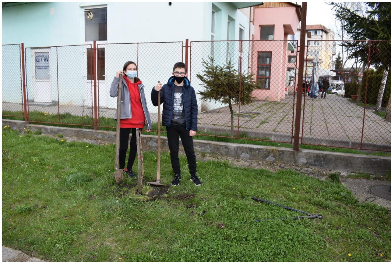
3.kép Föld-napi fákat ültettek a Bánffyhunyadi "Vlegyásza" Szakképző Liceum diákjai

Föld-napja alkalmából iskolánk néhány vállalkozó tanulóival az iskola udvarán fáültetési akciót szerveztünk (3. kép).