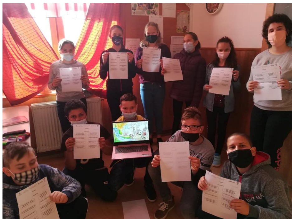
Fénykép 2.: VI. osztály