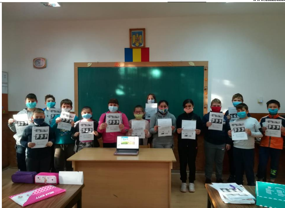
Fénykép 1.: V. osztály