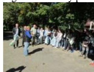
Te Szedd Akció

A fentiek alapján Diákkörünk a városunk és a kistérségünk a fenntarthatóságra nevelés, a környezettudatos szemléletformálás meghatározója lett a fiatal és a felnőtt társadalomban egyaránt. Akcióinkról minden esetben beszámolunk intézményünk honlapján ( vrfg.sulinet.hu ), Facebook-oldalán. Emellett a városi tv-ben (Nameny tv) és a www.beregihirek.hu internetes oldalon. 2000-2012-között 300 magyarországi, kárpátaljai, kelet-szlovákiai, partiumi középiskolát megszólító négy nyelvű, nemzetközi környezetvédelmi vetélkedőt szerveztünk. Emellett számos HURO.HUSKROUA, EFOP programban vállaltunk kezdeményező, vagy megvalósító szerepet az elmúlt évek során. Helyi termelők napját és Adventi jótékonyági főzőversenyt szervezünk. 1990-től harminc éven át szerveztünk nyári nemzetközi környezetvédelmi táborokat a beregi Barabás községben a Kaszonyi hegyen.