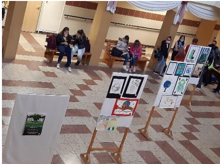
2. ábra Rajzokból nyílt kiállítás

A nap folyamán olyan témák feldolgozásán vehettek részt a tanulók, mint a klímaváltozás, a globális felmelegedés okainak és veszélyeinek vizsgálata, valamint a szelektív hulladékgyűjtés és újrahasznosítás fontossága.