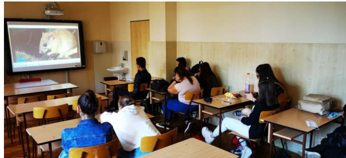
3. ábra Globális felmelegedést bemutató óra