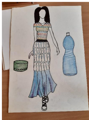
Újrahasznosított ruhák tervei