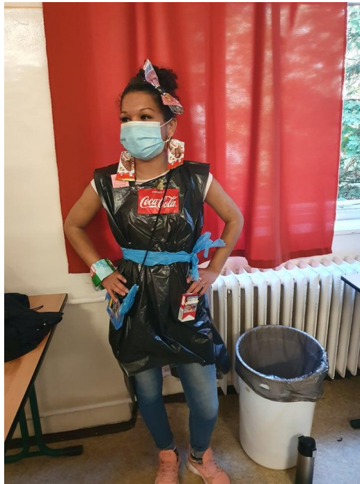
MODE a Keriben