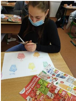
Plakátkészítés a szelektív szemétszedésről kereskedelmi gyakorlaton