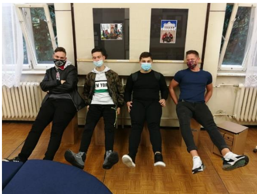
és kipróbálva (a fiúk papírkarton-széken ülnek)