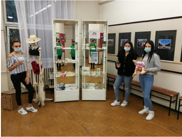
Egy kiállítás képeiben