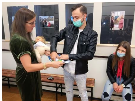
Mosi- pelenka –időben meg akarom tanulni...