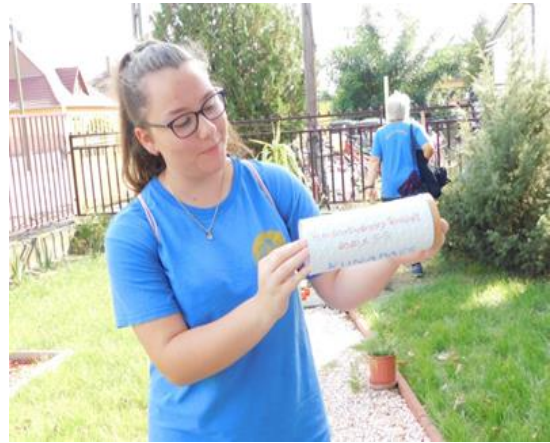
2. idő kapszula