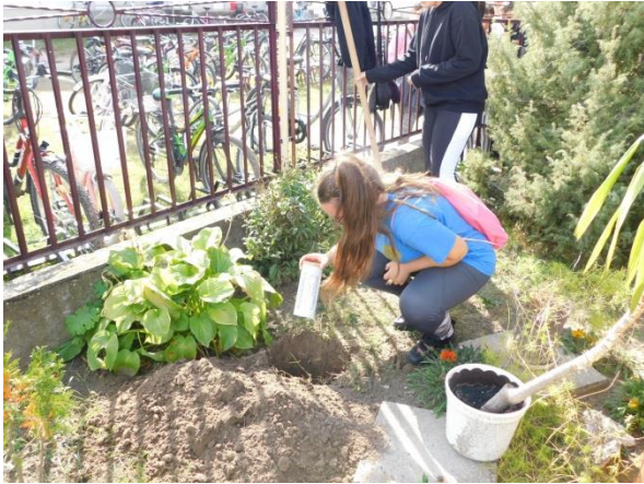
1. Idő kapszula elhelyezése