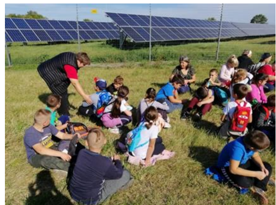
6. Túra a napelem parkhoz