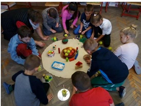
5. lelki egészség