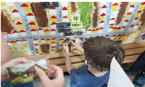
13. Ismerd meg településed.