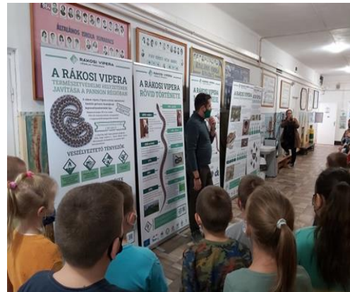
12. Rákosi vipera mentési program