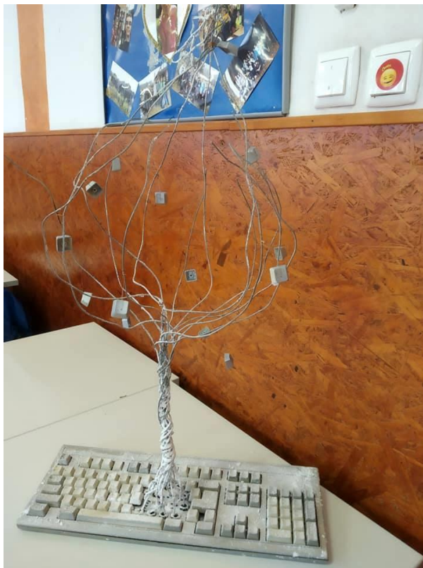
Számítógép periféria, mint modern alkotás

Tanítványainknak rendszeresen rendezünk versenyeket a hulladékok újrahasznosításával kapcsolatban. Az alábbi fotókon a nyertes művek láthatóak.