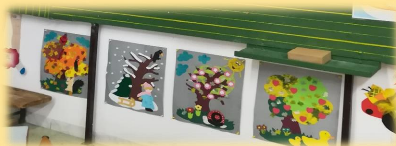
Évszakokat ábrázoló tablók