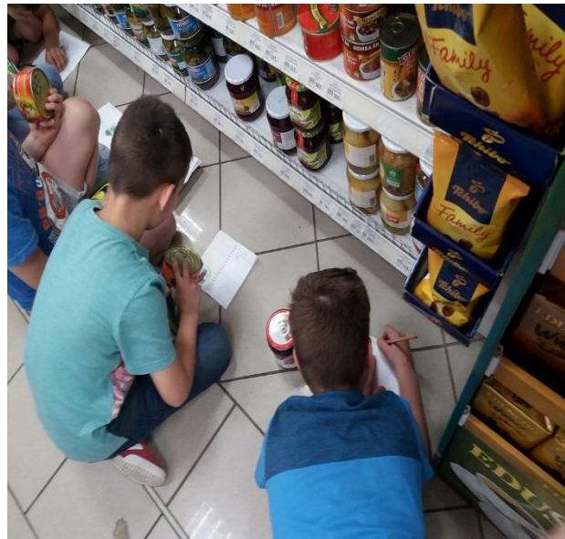
2.b osztály a Coop boltban