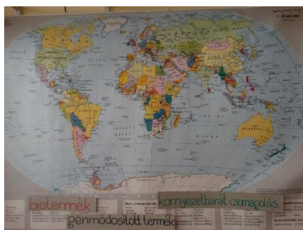
Milyen messziről jönnek élelmiszereink