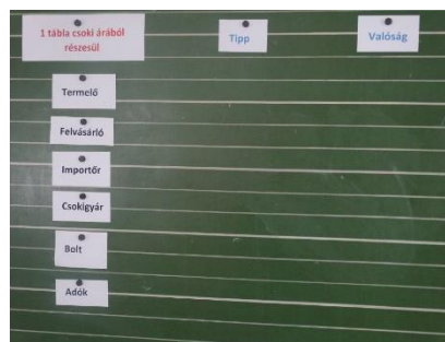
Fair Trade kereskedelem